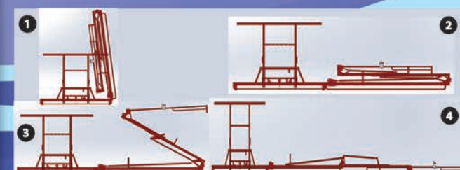
BARRAS DE 14, 15, 16 Y 18 MTS.