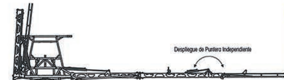
Despliegue de Puntera Independiente